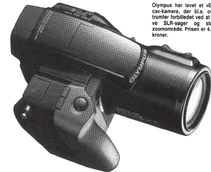
Olympus har lavet et »Epo-ca«-kamera, der bl.a. overtrumfer forbilledet ved at have SLR-søger og større zoomområde. Prisen er 4.695 kroner.

»One-shot« kender man fra ethvert lommekamera. Du sigter mod hovedmotivet, trykker udløseren